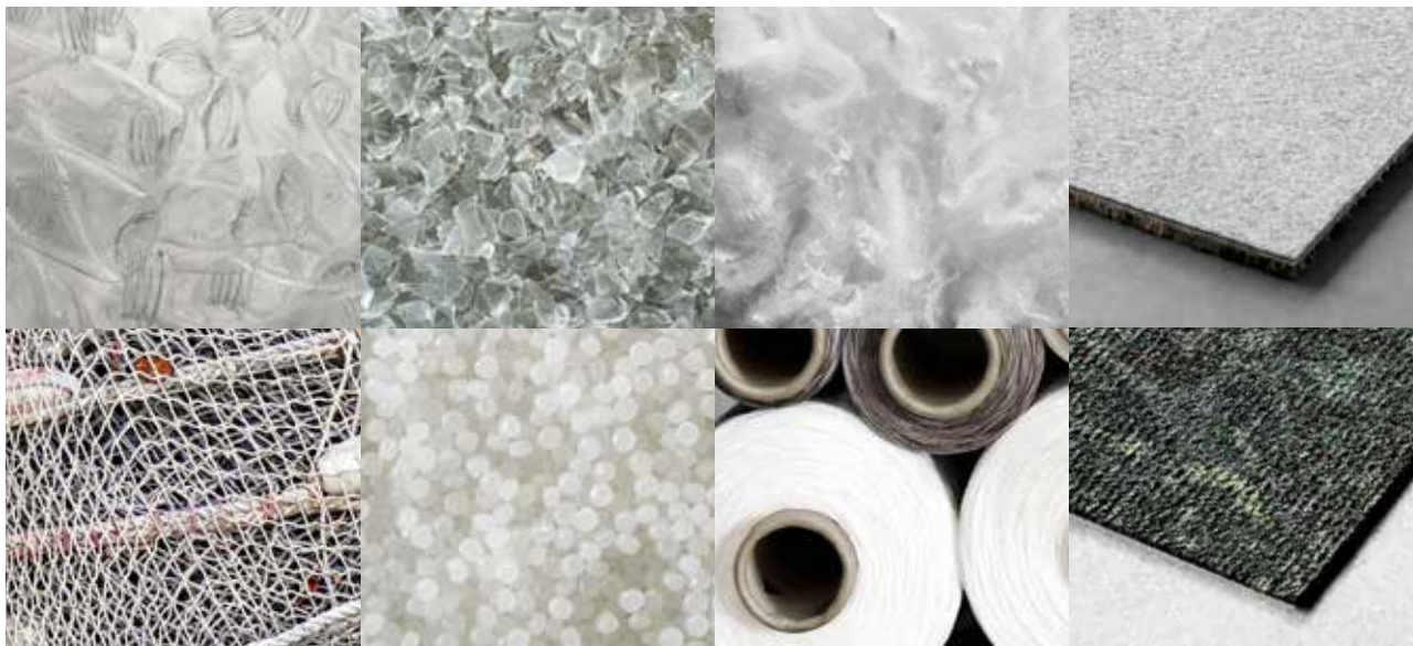
Filets de pêche